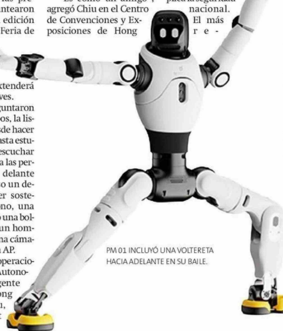
PM 01 INCLUYÓ UNA VOLTERETA HACIA ADELANTE EN SU BAILE.

Con esto se busca cerrar la brecha en "el intercambio de calidez y emoción con el ser humano. Además, (las máquinas) ayudarán a las personas a tomar decisiones y completar sus tareas", sostuvo el representante de la firma cuyo dispositivo supera los US$25.000.