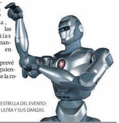
LA ESTRELLA DEL EVENTO: X2 ULTRA Y SUS DANZAS.