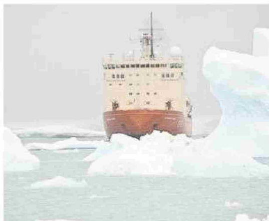
El rompehielos "Almirante Irizar" en tareas logísticas antárticas.