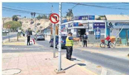
PERSONAL MUNICIPAL EN EL LUGAR.

el Puente Brasil, el director regional de Vialidad indicó que "tenemos antecedentes que esto fue producto del impacto de un camión".