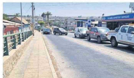
SUSPENSIÓN Y PASO POR SOLO UNA CALZADA PROVOCÓ TACOS.

tiempo que esta era una situación que lamentablemente en algún rato tenía que reventar y lamentablemente nos tocó asumirla a nosotros a pocos días de haber asumido nuestro gobierno como tal".