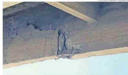
DAÑO HABRÍA SIDO PROVOCADO POR UN CAMIÓN.

"Esta es una situación que lamentablemente tiene para un buen tiempo. Es una situación que se arrastra también desde hace mucho tiempo y que afecta directamente a nuestra comunidad. Quienes estamos inmiscuidos en el servicio público sabemos que desde hace mucho