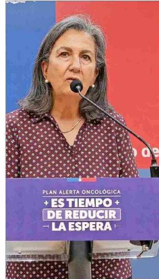
La ministra de Salud y otras autoridades de la cartera presentaron ayer el Plan de Alerta Oncológica.

La Corte no alcanzó a pronunciarse sobre la orden de no innovar, como solicitó la recurrente, antes de que el Servicio de Salud de Valparaíso y San Antonio procediera a designar un director subrogante, aunque aún está pendiente el proceso de selección de un nuevo titular en ese cargo.