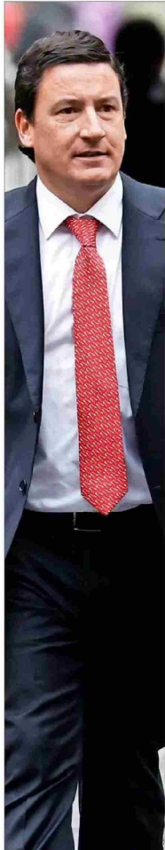
Arturo Suello, senador y presidente del P. Republicano

A poco de entrar los 50 días de la actual administración —se cumplen mañana 30—, la coalición gobernante transluce una serie de diferencias internas por estilos de autoridades o maneras de lidiar con la oposición.