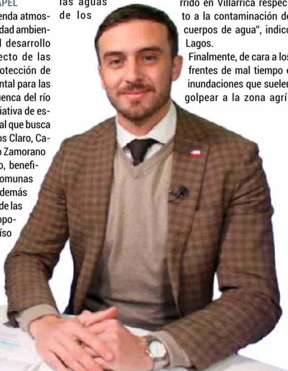
La autoridad del ambiente anunció 20 estaciones de monitoreo de calidad de aguas en los ríos de la región.

Finalmente, de cara a los frentes de mal tiempo e inundaciones que suelen golpear a la zona agrí-