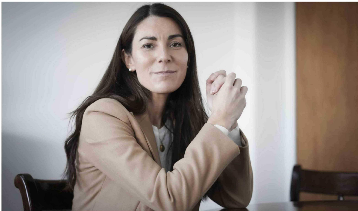
► La ministra de Educación, María Paz Arzola, defiende el proyecto de Escuelas Protegidas en los colegios.

Tiraje: 78.224 Lectoría: 253.149 Favorabilidad: No Definida