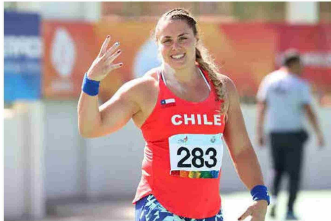
Futura ministra del Deporte cuestionada por exdeportistas por su doping en 2018.

sido castigados y despojados de sus títulos deportivos al verse enfrentados a castigos que van desde dos, tres y cuatro años. Si bien el tema "doping" en el deporte chileno estaba casi superado, lo cierto es que el reciente nombramiento