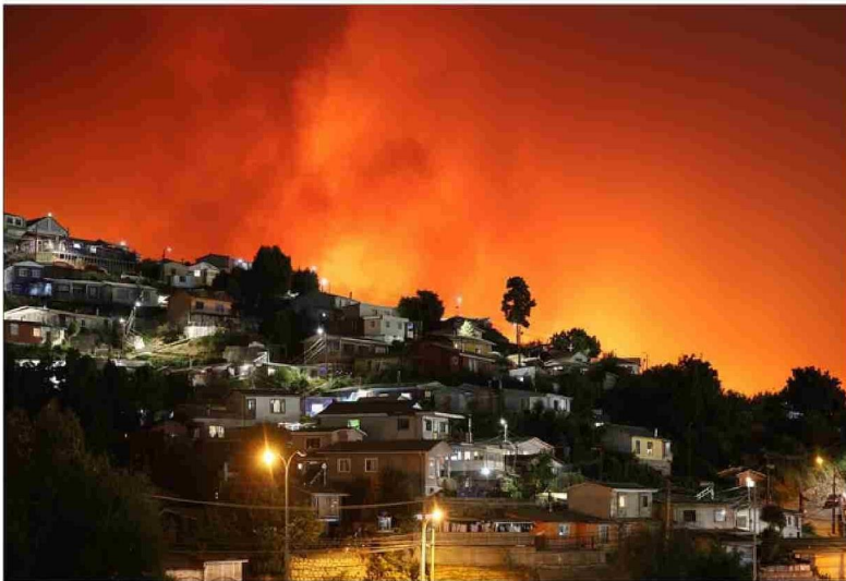
El fuego avanzó en 12 horas. Así se veía en Penco.

El ingeniero forestal, de paso por el país, entrega cinco claves para entender cómo se decide combatir los focos.