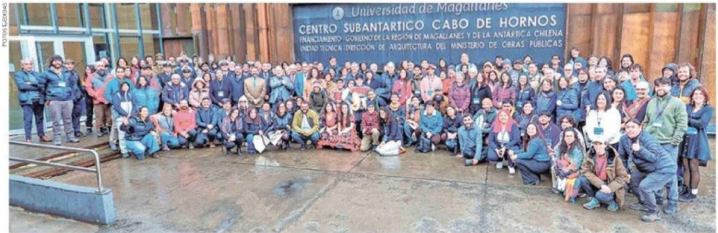
Los asistentes a la primera jornada del evento internacional realizada este lunes en la ciudad más austral de Chile, Puerto Williams.