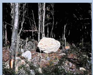
Carolina Oltra exhibe una fotografía lumínica, que busca ser una entrada poética a la exploración del paisaje.