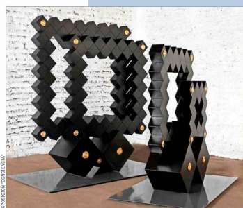
Soledad Chadwick trabajó con técnicas del Renacimiento en las pequeñas piezas pintadas doradas. Alude al patrimonio y a la ecología.