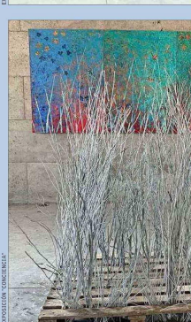
La artista Verónica Aspillaga sumerge en la naturaleza con su mural pictórico, pero a la vez denuncia con su instalación de ramas muertas la depredación.