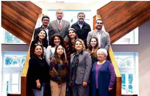
El Consejo de Sustentabilidad articula el trabajo de la UCT en estas materias.

Así es como en los últimos años se han inaugurado diversos edificios con sello verde, entre ellos el Pabellón Docente y el Campus Nuestra Señora de Lourdes (que alberga el Hospital de Simulación), espacios que reflejan cómo la universidad ha ido adaptan-