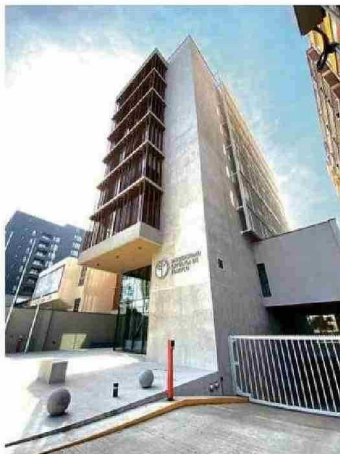
Campus Nuestra Señora de Lourdes.