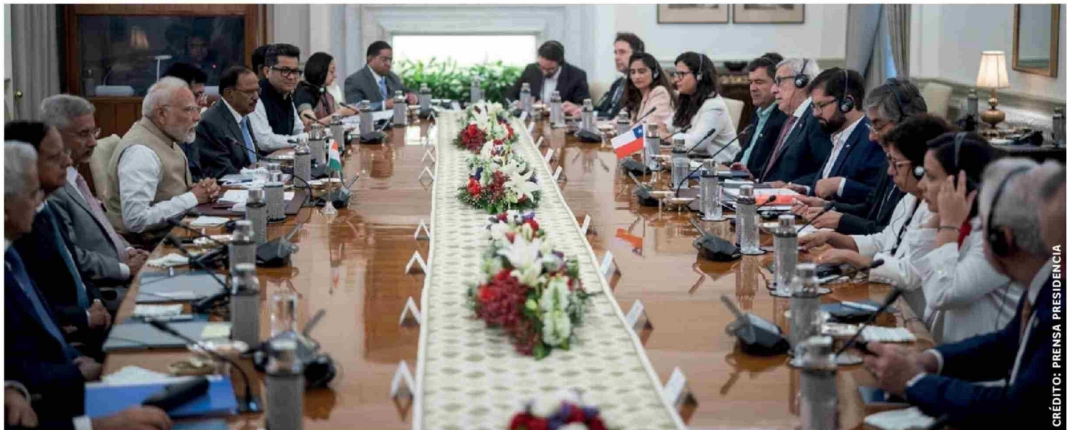
EL TRATADO DE LIBRE COMERCIO con la India podría abrir una ruta clave para productos forestales, pesqueros, agrícolas y vitivinícolas.

Tras su participación en la gira de Estado realizada el año pasado en el país asiático, el líder regional ha enfatizado la urgencia de avanzar en negociaciones que permitan abrir las puertas a la nación que hoy ostenta la mayor población del mundo. Según la visión del ejecutivo, esta estrategia no es solo una oportunidad de expansión, sino una medida necesaria para asegurar la estabilidad del desarrollo futuro ante los vaivenes de la economía internacional.