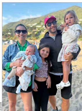
Acaba de tener a León, su tercer hijo.

En este verano quiere que sus dos hijas, de 8 y 4 años, se entusiasmen con este deporte. “La mayor logró esquiar a los cinco años después de harta pelea, pero la idea es que este año enganche de verdad”, señala el CEO de Global. En cambio, la de al medio dice que está “al límite de intentarlo, pero es difícil de convencer”.