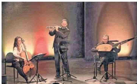
Hermenéutica Armónica destaca en el medio de la música antigua.

Es así que hoy la cita se dividirá en tres bloques: de 9 a 13, se realizarán actividades prácticas en el Colegio Médico local. Luego, desde las 15 horas, en el mismo audi-