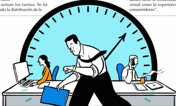
FRANCISCO JAVIER OJEDA

Se suman los turnos. Se ha ajustado la distribución de la