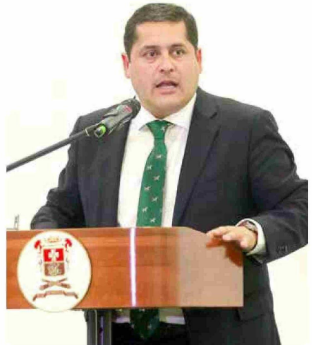
Alcalde de Linares, Mario Meza.

En diciembre del año pasado, Contraloría lo removió de sus funciones. Sin embargo, la Corte Suprema dictaminó que Contraloría no tiene la competencia para destituir a alcaldes, por lo que Rivera sigue en su cargo.