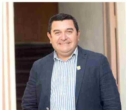
Alcalde de Pelarco, Cristian Cabrera.