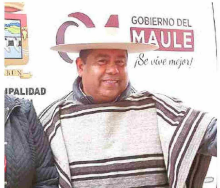
Alcalde de Colbún, Pedro Pablo Muñoz.