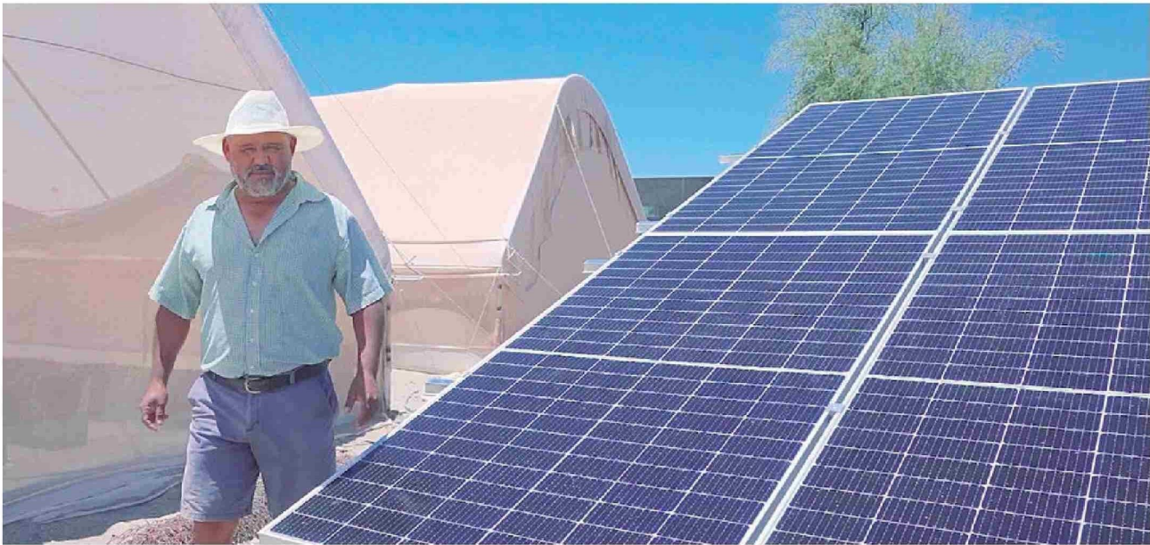
Programas (PAR) de apoyo a Pymes en energías renovables

Corporación estatal en Tarapacá realizó balance al cumplirse el 87° aniversario de la institución de fomento.