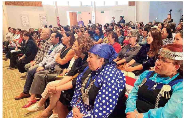
Beneficiarias del Programa Viraliza Eventos en Congreso Intercultural