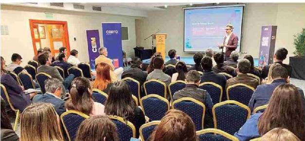
Seminario de Inteligencia Artificial: PDT Corfo y CEIM.