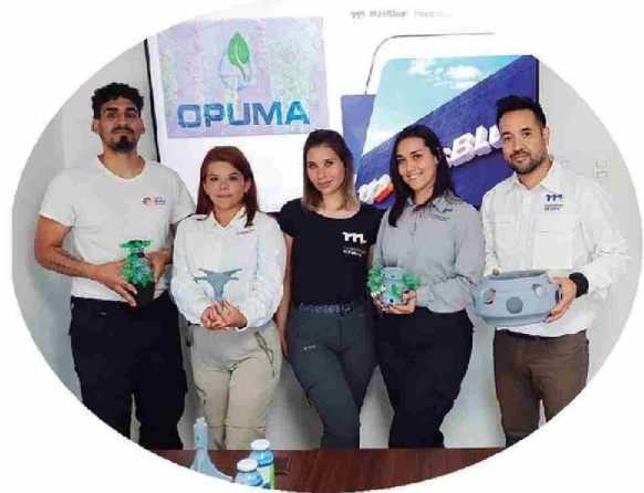
Proyecto Opuma de la línea Innova Región desarrollado por Más Blue.