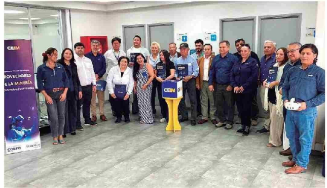
Beneficiarios de Programa de Difusión Tecnológica (PDT) "Proveedores de la Minería: Corfo y CEIM".