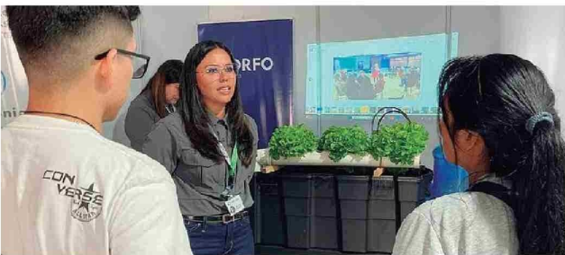
Proyecto de Bien Público "Hidroponía costera de Tarapacá"