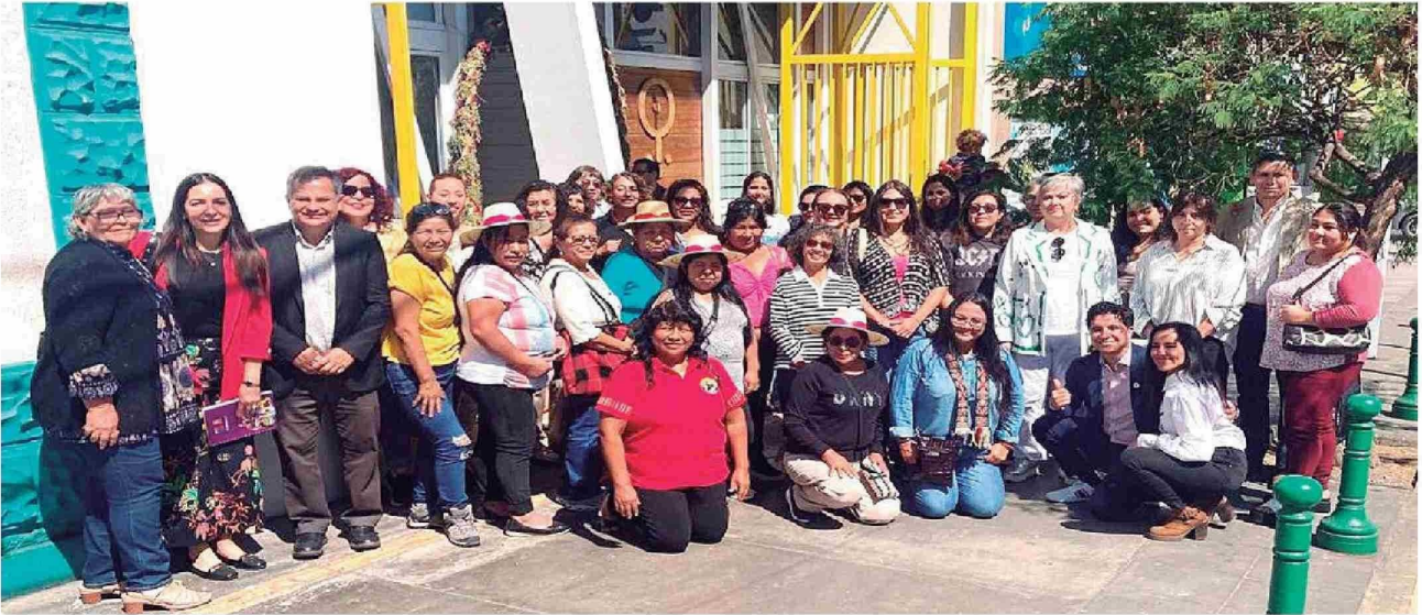
Equipo organizador de proyecto Viraliza Eventos "Suma Tarapacá".