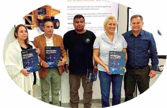
Certificación beneficiarios de Programa de Difusión Tecnológica (PDT) "Proveedores de la Minería: Corfo y CEIM"