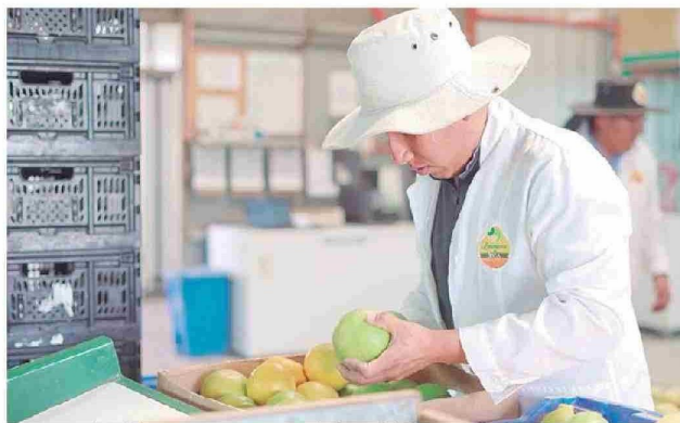
Programa (PAR) de apoyo a Pymes en agricultura del Tamarugal

A lo anterior, se suman la Iniciativa de Fomento Integrado (IFI) para una plataforma logística en Alto Hospicio (332 millones de pesos), el Programa Estratégico Regional (PER) Descubre Tamarugal (120 millones de pesos), la Bonificación a la Inversión en Zonas Extre-