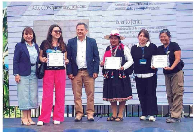
Beneficiarias certificadas en Barrio Playa Brava de Viraliza Eventos "Suma Tarapacá".