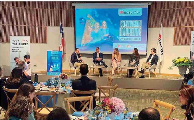
Programa Viraliza Formación "Crea Mentores" de Corfo e Inacap.