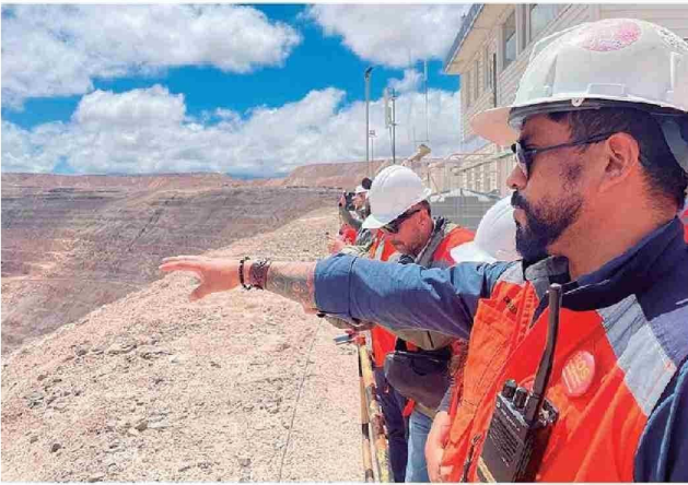
Programa de Difusión Tecnológica (PDT) "Proveedores de la Minería: Corfo y CEIM".

En 2026 apoyará a mil 266 beneficiarios en 256 proyectos.