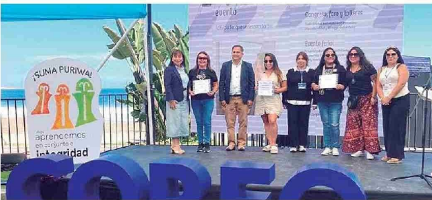
Evento Comercial e Intercultural en Barrio Playa Brava de Iquique del programa "Suma Tarapacá".