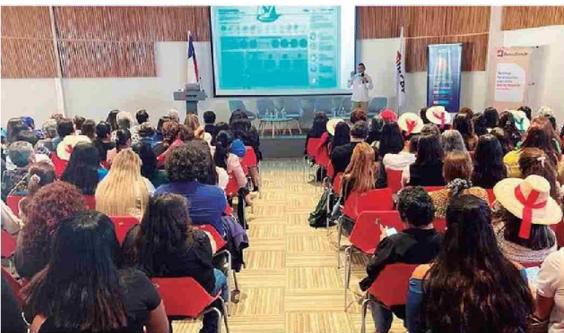
Programa Viraliza Eventos: Congreso apoyado por Corfo y desarrollado por "Suma Tarapacá".