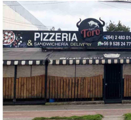
EL CALLE TARAPACÁ TAMBIÉN HAN SURGIDO OPCIONES CULINARIAS.