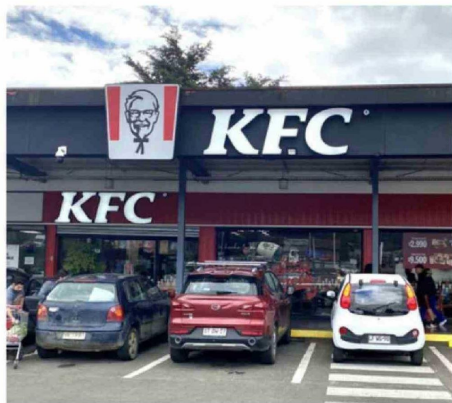
LA FRANQUICIA INTERNACIONAL KFC FUNCIONA EN EL STRIP CENTER.