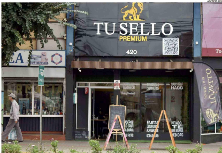
NÚMEROSOS LOCALES GASTRONÓMICOS HAN ABIERTO SUS PUERTAS EN LA AVENIDA REPÚBLICA, EN RAHUE BAJO, TAL COMO TU SELLO PREMIUM.

República es una de las arterias más reconocidas por la comunidad osornina, gracias a más de un siglo de historia y tradición. Es la puerta de entrada al sector con mayor densidad poblacional de la comuna, como es Rahue, y ha sido testigo del desarrollo económico y comercial que ha florecido a su alrededor, atravesando tanto épo-