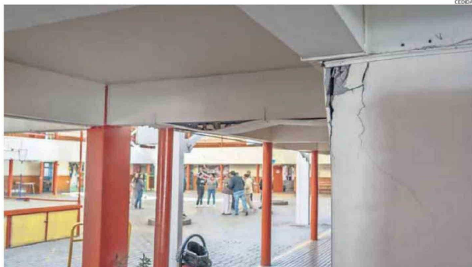
LA ESCUELA VALENTÍN LETELIER FUE UNA DE LAS AFECTADAS EN SU INFRAESTRUCTURA TRAS EL TERREMOTO DEL PASADO LUNES EN CALAMA.

El delegado provincial sostuvo además que, pese a la magnitud del sismo, no se registraron personas lesionadas ni interrupciones mayores en los servicios de urgencia. Según detalló, existen algunas viviendas reportadas con derrumbes de paredes, mientras que Bomberos concurren a dos emergencias para rescatar personas que permanecían atra-