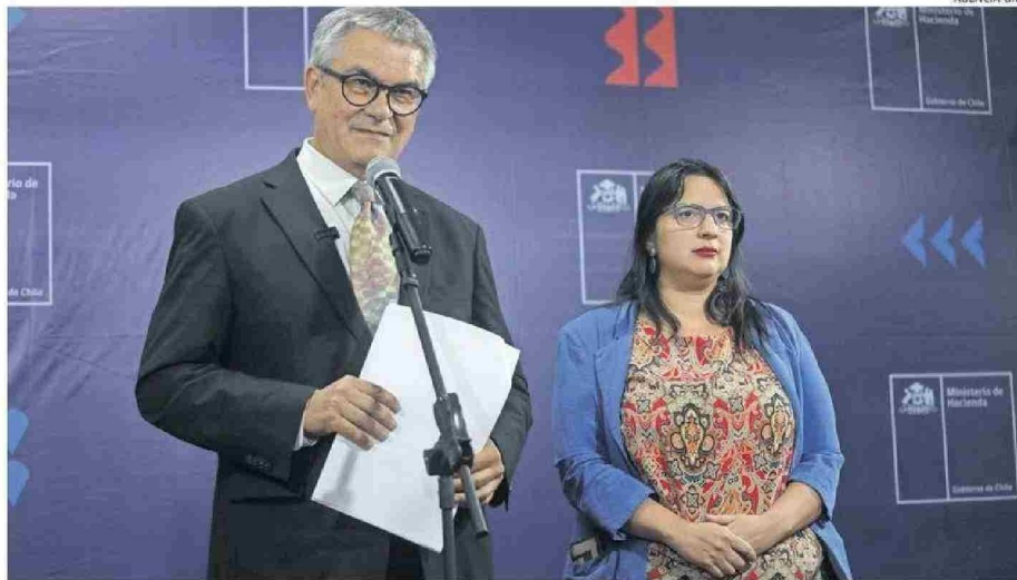
TAMBIÉN SE INSTAURÓ UN COMITÉ NACIONAL DE AUSENTISMO PARA PREVENIR Y REDUCIR ESTAS CONDUCTAS.