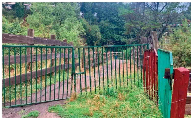
EL PASEO EN LANCHA de los Saltos del Laja estuvo suspendido durante parte del verano, reduciendo la oferta turística del sector.

abordando materias como el control del comercio, la seguridad pública, la limpieza del entorno y el manejo de residuos", señalaron.