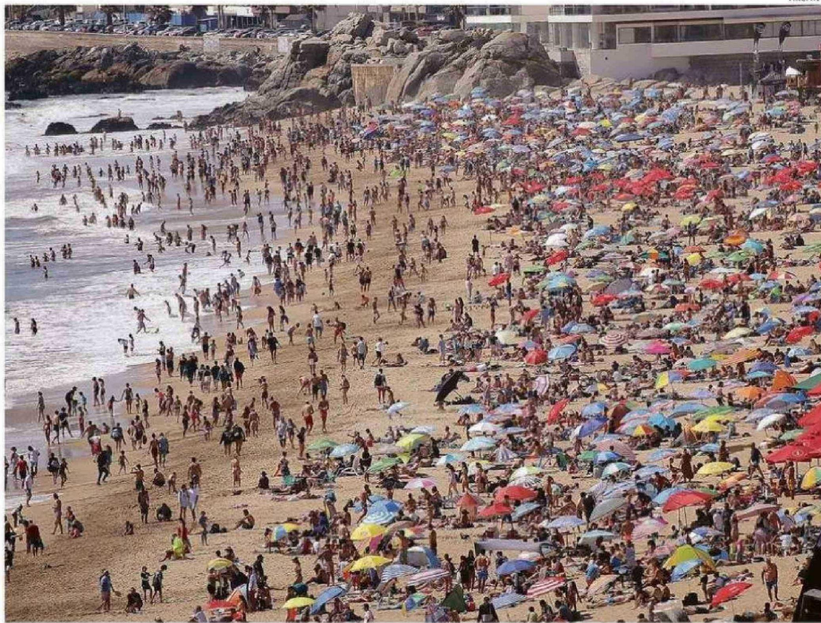
NO CABE UN ALFILER, ALGUNAS PLAYAS DE LA ZONASE HAN REPLETADO DURANTE LOS PRIMEROS DÍAS DEL AÑO.

Este fenómeno queda en evidencia en las proyecciones de ocupación para la primera quincena de enero. Según cifras entregadas por la Corporación Regional de Turismo, zonas del interior llevan buenos porcentajes de reserva,