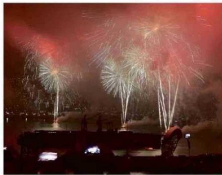
EL SHOW DE FIN DE AÑO, UNO DE LOS PRINCIPALES ATRACTIVOS.

como la provincia de Marga Marga, con un 74,64% de ocupación, y la provincia de Petorca, con un 70,60%. Estos números confirman que el turista argentino no solo se concentra en el borde costero, sino que también está recorriendo comunas fuera del circuito tradicional.