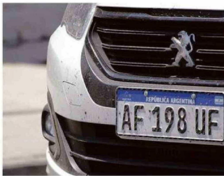
SE HA VUELTO COMÚN VER PATENTES ARGENTINAS EN LAS CALLES.