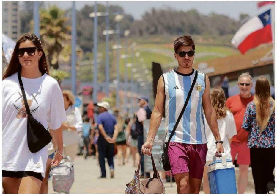
EL PERFIL ACTUAL MUESTRA A GRUPOS DE AMIGOS Y FAMILIAS QUE OPTIMIZAN SU PRESUPUESTO PARA DISFRUTAR DEL LITORAL CENTRAL.

En términos de logística, el reporte trasandino indica que 7.989 vehículos particulares y 217 buses de larga distancia cruzaron hacia Chile entre el último viernes de 2025 y el día 31. Un dato clave es la