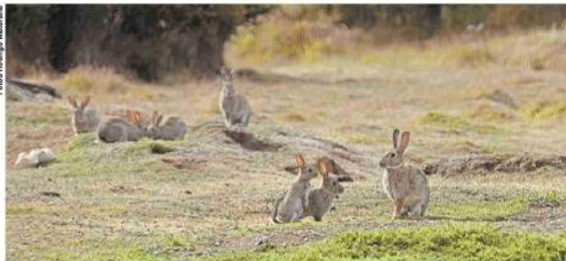
Visible es el aumento de conejos y sus madrigueras en el sector del Cadi-Umag.

El conejo europeo es una especie exótica invasora introducida en Tierra del Fuego desde Europa. Al encontrar condiciones favorables para su reproducción y carecer de depredadores naturales, se diseminó por todo el territorio, causando daños ecológicos importantes, como la destrucción del suelo y la eliminación de