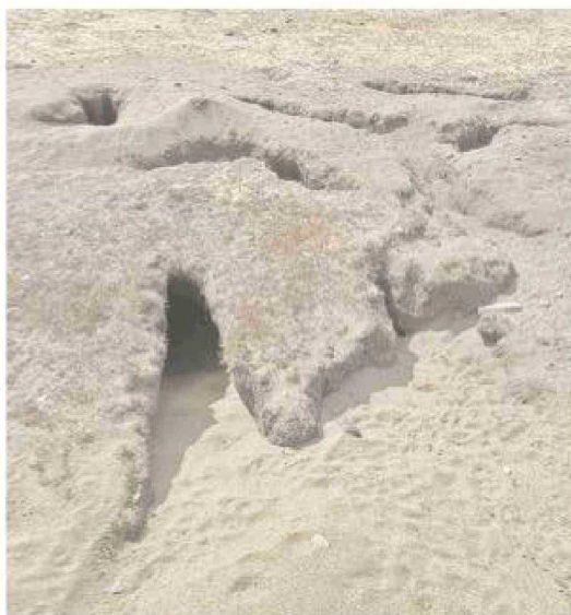
Esta madriguera se encuentra a la orilla de la ruta a la altura del kilómetro 5 sur.

"A mí personalmente me encantan los conejos, pero son una plaga que molesta mucho. Roen todo: los árboles, las plantas, el pasto. Y hacen hoyos por todas partes".