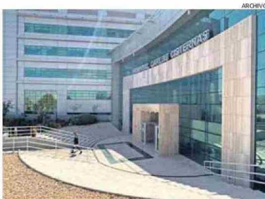
CONCLUYEN OBRAS DE UNIDAD DE QUIMIOTERAPIA EN EL HOSPITAL.