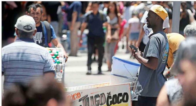
TENSIÓN CON FORÁNEOS. — La edición 2023 refleja la percepción de la opinión pública sobre el impacto del fenómeno migratorio que vive Chile en los últimos años.