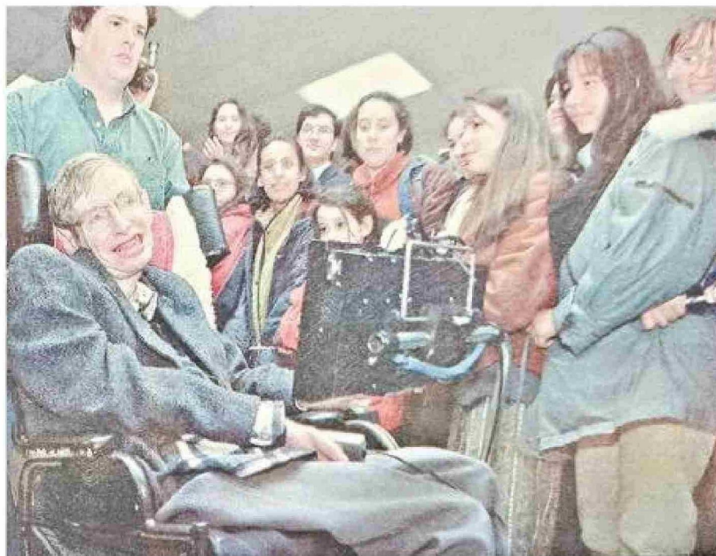
El 20 de agosto de 1997, en pleno invierno, Stephen Hawking aterrizaba en Punta Arenas, uno de los más importantes científicos del siglo XX que pasará a la historia por sus grandes teorías sobre el origen del universo. A su arribo recibió espontáneas muestras de afecto, especialmente de niños y jóvenes.

Pisaron el planeta tierra los Australopithecus, el primer ser humano, su cabeza era muy pequeña. Existieron hace 4 millones de años. Además su estatura no sobrepasaba un metro; Homo Habilis existió hace 2,5 millones de años. Su cráneo creció poco más para darle paso al desarrollo del tamaño del cerebro; Pithecanthropus Erectus