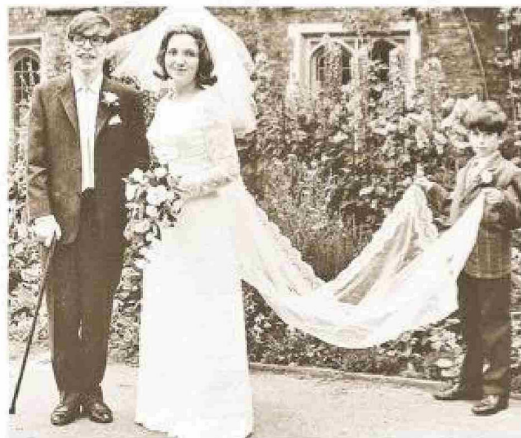
A los 19 años, Hawking sintió los primeros síntomas de su mal. No sabía lo que era. No lo supo hasta dos años después, cuando el diagnóstico dijo ELA y él estaba ya en pareja con Jane Wilde. Se casaron el 14 de julio de 1965.

El profesor Stephen Hawking investigó toda su vida las leyes básicas que rigen el universo. De hecho fue el primero en elaborar una ecuación para unificar la relatividad general y la física cuántica. Su principal contribución a la ciencia reside en la conocida teoría del todo, palabras que da nombre, por cierto, a su película biográfica. Es decir, fue el primer educador científico que unificó la Teoría de la Relatividad General de Albert Einstein con las leyes de la física cuántica de Max Planck. Hawking dejó las nuevas bases para seguir las generaciones humanas investigando y estudiando el vasto universo, incluido desde Magallanes Antártico.