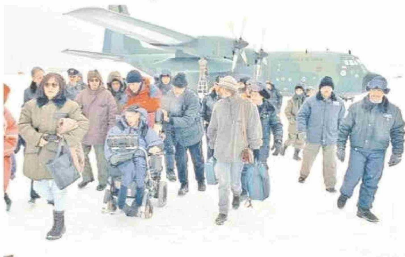
El 21 de agosto de 1997, el científico británico descendía en su silla de ruedas del avión Hércules de la Fach que lo trasladó a la Base Presidente Frei, en la Antártica.

En marzo de 1959 a la edad de 17 años, Hawking ingresó en la Universidad College de Oxford, donde se licenció en 1962 con los títulos de matemáticas y física. En octubre de 1962, a la edad de 20 años había iniciado sus estudios de doctorado en el Trinity Hall de Cambridge. Su doctorado, completado en 1966 a la edad de 24 años, se centró en matemáticas aplicadas y física teórica, con un enfoque particular en la relatividad general y la cosmología; con su tesis titulada “Propiedades de los universos en expansión”. Ese mismo año, Hawking también ganó el prestigioso Premio Adams por su ensayo titulado “Singularidades y la geometría del espacio tiempo”. Es significativo para su carrera profesional, cuando John Archibaldo Wheeler introdujo el término agujero negro en 1967, reemplazó a la anterior estrella congelada. Como hecho histórico para la humanidad y para el educador inglés es que el Apolo 11, entre el 16 y el 24 de julio de 1969, viajaron a la Luna, los astronautas Neil Armstrong, Michael Collins y Buzz Aldrin; con éste último compartió personalmente a futuro conocimientos científicos con Stephen Hawking. Los agujeros negros son uno de los fenómenos más enigmáticos del universo: para que se formen, primero una estrella tiene que morir. Además, todo lo que entra, jamás