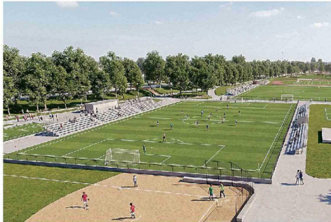
LA REMODELACIÓN DEL PARQUE DYR INCLUYE NUEVAS INSTALACIONES PARA LA PRÁCTICA DEPORTIVA.

oportunidades para potenciar la empleabilidad y el desarrollo de nuestros estudiantes y comunidades en general”.