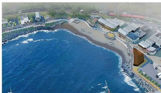
EL PROYECTO TAMBIÉN EJECUTARÁ UN PLAN DE MEJORAMIENTO DE LA PLAYA PACHECO ALTAMIRANO.

hectáreas de paseos y parques se construirán como compensación a la comunidad.