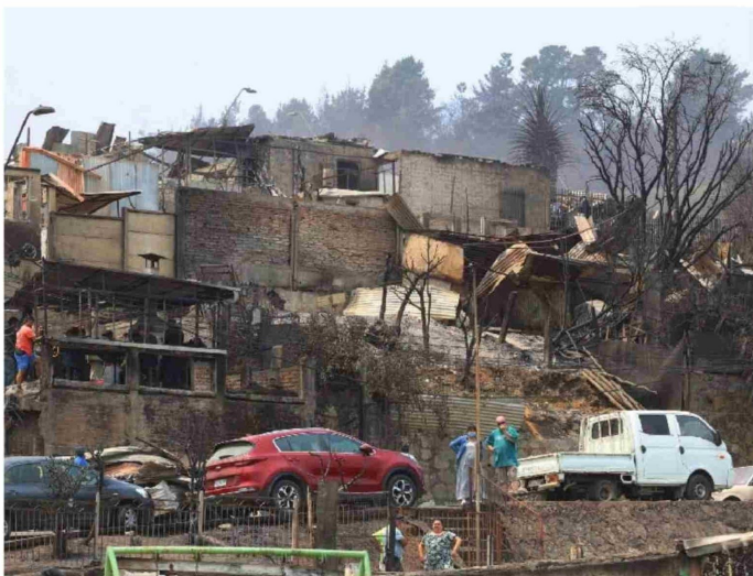
► En Penco el número de evacuados asciende a 30 mil, según último balance.