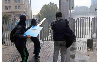
Vándalos. Se registraron barricadas y daños a señaléticas en distintos puntos cercanos al recorrido.

Cortes en la Alameda se prolongaron hasta pasadas las 15:00 horas de ayer: