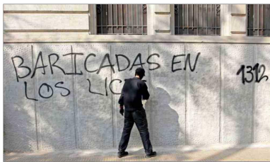
'Barricadas'. Encapuchados dañaron con sus consignas diversos muros del eje Alameda.