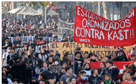
MARCHA EN SANTIAGO. Los estudiantes se reunieron en Baquedano y enfilaron hacia Los Héroes, pasando frente a La Moneda. Según los jóvenes, fueron 50 mil los asistentes...