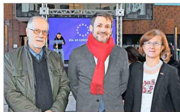
Rafael Garranzo, embajador de España; Diego Pardow, ministro de Energía; y Edit Bucsi-Szabó, embajadora de Hungría.

El encuentro contó con stands de los distintos países europeos con degustaciones de sus productos, y, por primera vez, con un stand chileno organizado por ProChile, que ofreció productos nacionales reconocidos con denominación de origen en el nuevo Acuerdo Comercial UE-Chile. También hubo presentaciones de danzas folclóricas europeas y de cueca chilena, celebrando el cruce cultural entre ambas regiones.