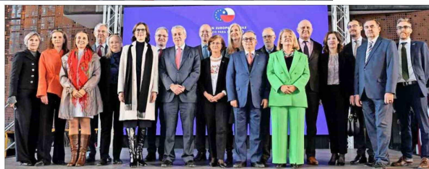
La embajadora de la Unión Europea en Chile y el ministro de Relaciones Exteriores junto a embajadores de los Estados miembros de la Unión Europea.