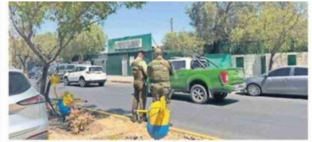
HABLÓ MADRE DE ALUMNO QUE AGREDIÓ CON ARMA BLANCA EN LEZAETA

En este aspecto, resulta primordial el espacio destinado a la oración y reflexión valórica que promueve la unión, la esperanza y un ambiente seguro dispuesto por la dirección administrativa del colegio, tal como ocurrió en la jornada de ayer, con los alumnos de 1° a 5° años de la enseñanza básica, y que se replicará con el resto de los estudiantes en este retorno gradual a la "normalidad".