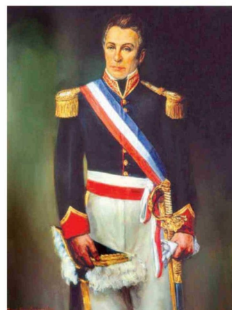
En las elecciones del 13 de febrero de 1827, para el período 1827-1832, fue electo Presidente el general Ramón Freire, quien poco después renunció en el Vicepresidente Francisco Antonio Pinto -en la gráfica-, quien gobernó hasta el 2 de noviembre de 1829.