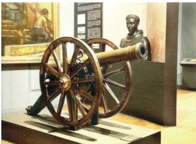
Cañón de época que se exhibe en el Museo de la Escuela Militar del General Bernardo O'Higgins.

...sos" nueve años se promulgaron dos constituciones: la moralista de 1823 y la liberal de 1828, además del llamado Ensayo Federal de 1826.