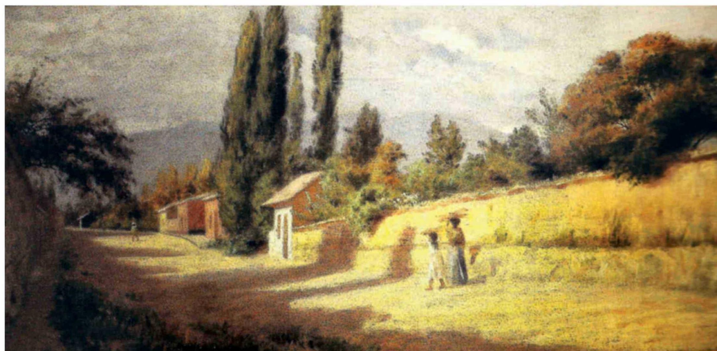
La somnolienta Villa San Agustín de Talca sufrió en 1827 uno de los grandes motines del período republicano de la primera mitad del siglo XIX. Evocador óleo sobre tela de Pedro Lira: “Atardecer. Escena de pueblo”. Colección privada del señor Canata.

Al respecto, el 7 de marzo de 1812 la Junta de Gobierno de Santiago, controlada por el coronel José Miguel Carrera, envió a Talca al Regimiento Granaderos, integrado por 900 soldados y 200 milicianos de caballería, al mando del brigadier Juan José Carrera, con el fin de impedir el avance de tropas penquista a la capital comandadas por el brigadier Juan Martínez de Rozas. Asimismo, el 18 de abril del mismo año el general Carrera salió de Santiago -investido de amplios poderes y con su amigo Manuel Rodríguez - rumbo a Talca, con una escolta de tropas de caballería, despachando el 25 de ese mes a un ayudante rumbo a Concepción con documentos para Rozas, en los que anunciaba que todo se zanjaría si ambos celebraban una conferencia en Talca, para lo cual la Junta de Gobierno penquista se trasladó desde Concepción hasta Linares escoltada por Rozas, quien avanzaba rumbo a la ribera del Maule con mil soldados de línea (Dragones de la Frontera) y 7 mil milicianos. Dicho ejército instaló su cuartel general en Linares, y Rozas, premunido de plenos poderes para negociar, pasó el río Maule con un reducido séquito a la orilla opuesta donde le esperaba Carre-