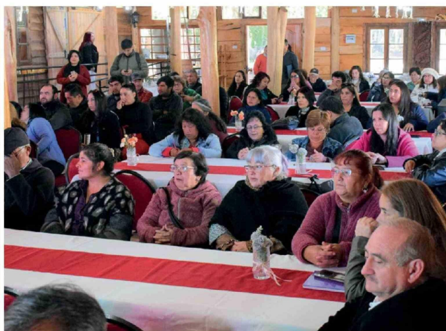
MÁS DE 70 PERSONAS PARTICIPARON en el Seminario de Turismo Rural y Patrimonio en Quilleco, instancia que buscó capacitar y articular a emprendedores en torno al desarrollo local.

de generar condiciones que les permitan crecer.