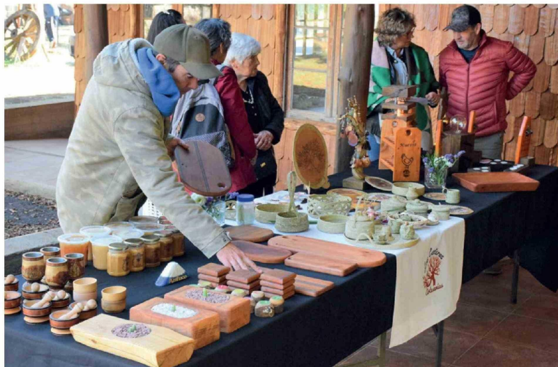
EMPREENDEDORES LOCALES VALORARON el encuentro como un hito para generar redes, visibilizar sus iniciativas y proyectar a Quilleco como un destino turístico en la provincia de Biobío.