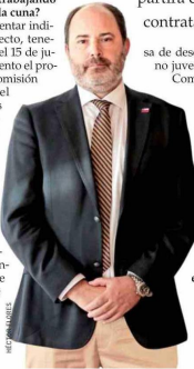
Tomás Rau, ministro del Trabajo.

—"Vamos a presentar indicaciones al proyecto, tenemos plazo hasta el 15 de junio. En este momento el proyecto está en la comisión de Educación del Senado y estamos trabajando en hacerlo financieramente sostenible, especialmente por la estrechez fiscal que estamos teniendo. Este proyecto está en un momento en que enfrentamos una emergencia laboral, sobre todo en la tasa de desempleo femenino, que está en 10% a nivel nacional, y la ta-