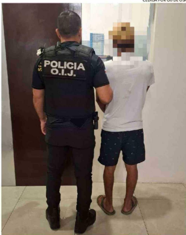
SE PEDIRÁ LA PRISIÓN PREVENTIVA POR EL IMPUTADO.