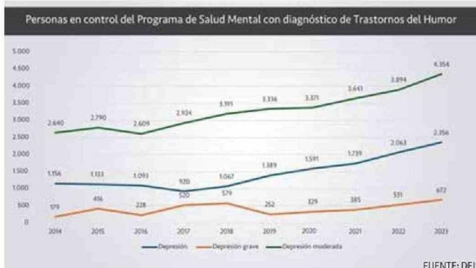
UNA ALARMA FUNDAMENTAL DE LA DEPRESIÓN ES LA PÉRDIDA DE INTERÉS EN ACTIVIDADES BÁSICAS.

tal en los centros hospitalarios o en otros centros".