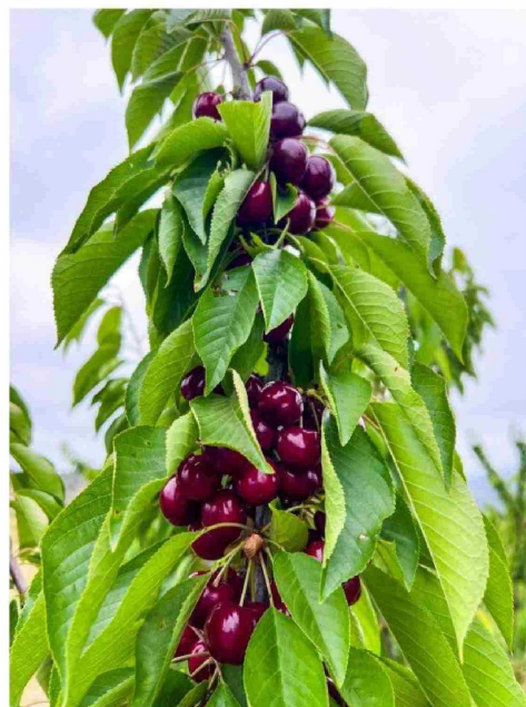
Huerto orgánico de cerezas en Sagrada Familia.