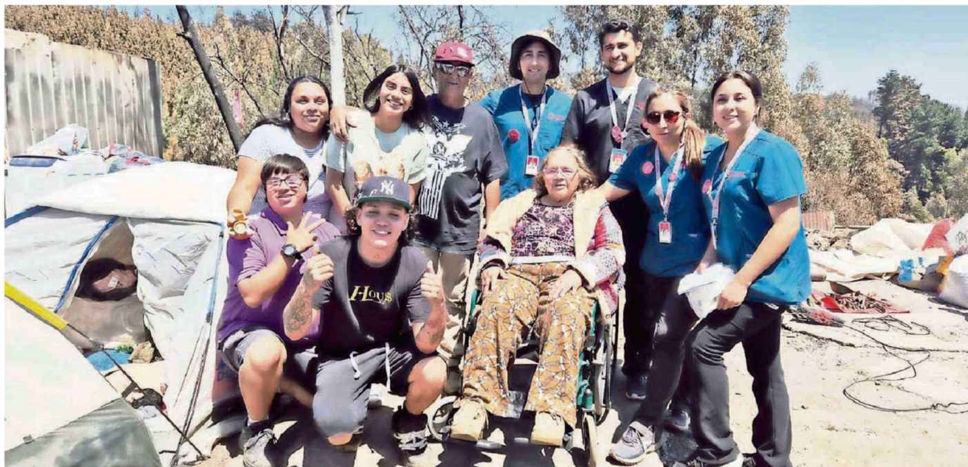
FUNDACIÓN LAS ROSAS REFUERZA OPERATIVOS MÉDICOS EN TERRENO Y COORDINACIÓN CON MUNICIPIOS PARA ACOMPAÑAR EL PROCESO DE RECUPERACIÓN Y RECONSTRUCCIÓN.