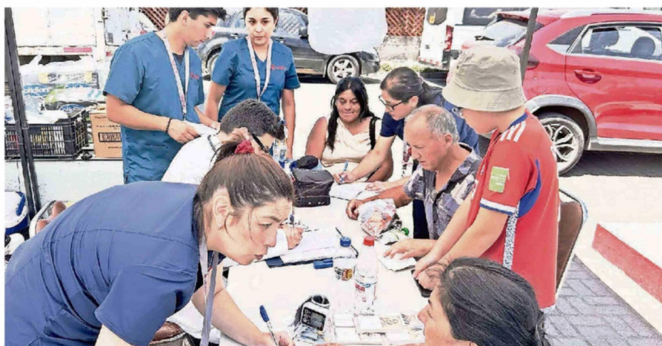
MUCHAS VÍCTIMAS SIGUEN DURMIENDO EN EL SUELO O EN CARPAS, SITUACIÓN QUE PROFUNDIRA EL DETERIORO FÍSICO Y EMOCIONAL.