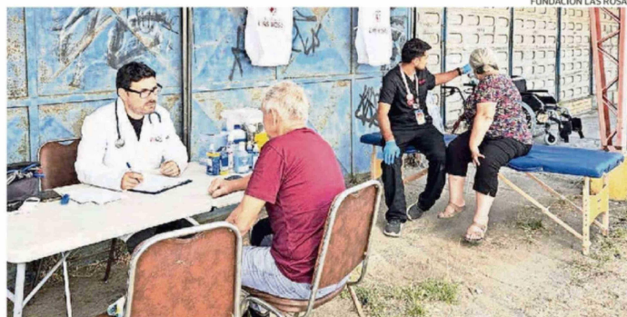
ESPECIALISTAS ADVIERTEN QUE LA INHALACIÓN DE HUMO Y EL ESTRÉS PROLONGADO PUEDEN GENERAR AFECIONES RESPIRATORIAS Y MUSCULARES DE LARGA DURACIÓN EN PERSONAS MAYORES.

sistir por meses y verse agravadas por el impacto emocional de haber perdido sus viviendas, situación que se manifiesta en contracturas, angustia y señales de posible depresión. Fundación Las Rosas ha atendido a más de un centenar de personas mayores y anunció un nuevo operativo. <3