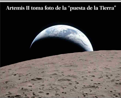
Los astronautas pudieron disfrutar de una perspectiva única del satélite y capturaron una imagen de nuestro planeta ocultándose detrás del horizonte lunar, fenómeno conocido como Earthset. Ya en su etapa final, la misión salió ayer de la influencia de la Luna y se dirige hacia la Tierra. El amerizaje está previsto para el viernes. | A 8

PERISTEN AMENAZAS DE VIOLENCIA EN ESCUELAS | C 1 OVEROLES BLANCOS: GRUPOS VIOLENTISTAS QUE DIFUNDEN SUS DELITOS SON OBJETIVOS DE PESQUISAS | C 2