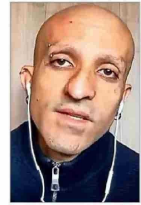
Declara por segunda vez ante la fiscalía sobre el episodio en que fue encontrado inconsciente y maniatado en una autopista.

SI BIEN EL GOBERNANTE ASEGURA QUE LA PAZ ESTÁ CERCA, CONTINÚAN LAS HOSTILIDADES | A 4 y B 1