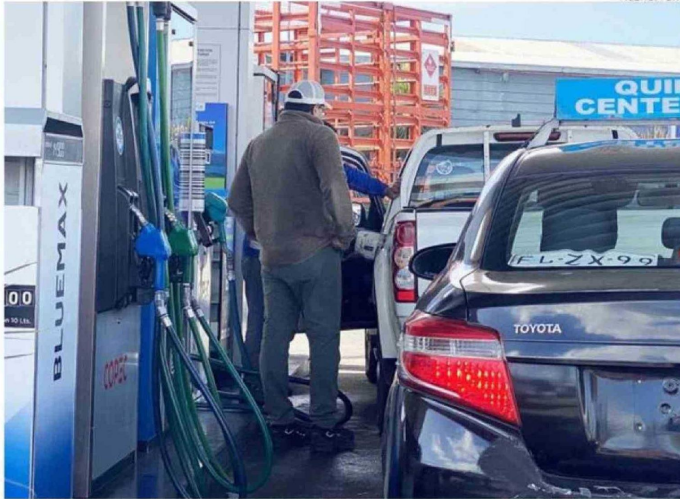
LOS VEHÍCULOS DE TRABAJO SON LOS QUE MÁS E VEN EN LAS ESTACIONES DE SERVICIO POR ESTOS DÍAS.

Este valor es cerca de $100 más alto que en la Región Metropolitana, donde el promedio bordea los $1.580 por litro.