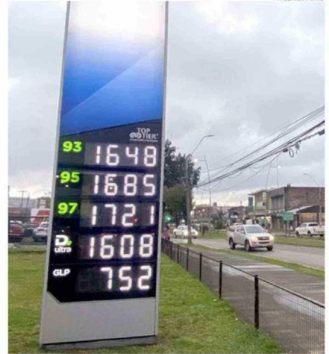
LA BENCINA DE 97 OCTANOS YA SUPERA LOS 1.720 PESOS EL LITRO.

más cuesta la gasolina de 95 octanos en Osorno que en la Región Metropolitana. En el Diesel la diferencia es bastante menor, pero sigue siendo más económico en la capital.