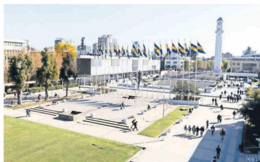
La acreditación por siete años, la transformación digital y la proyección de nuevos espacios fueron algunos de los principales hitos que marcaron la gestión institucional.

A su vez, añadió que el acontecimiento se inserta en una trayectoria institucional marcada por el fortalecimiento de la equidad de género. "En 2018 avanzamos en este reconocimiento al conformar un equipo directivo paritario y, en el segundo período, iniciado en 2022, tres de las cuatro vicerectorías fueron lideradas por mujeres", indicó.