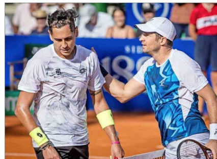
Tabilo perdió en arcilla con Dusan Lajovic en Buenos Aires 2024, pero se vengó en Indian Wells el año pasado.