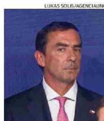
El ministro Fernando Rabat.

ministro del Interior, Claudio Alvarado. "Hay opiniones políticas que son legítimas", dijo el UDI a radio ADN, aunque aseguró que con el actual Gobierno tienen una "relación institucional que se lleva en muy buenos términos, y siempre puede emitirse una crítica política".