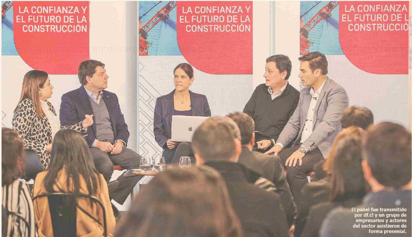
El panel fue transmitido por df.cl y un grupo de empresarios y actores del sector asistieron de forma presencial.