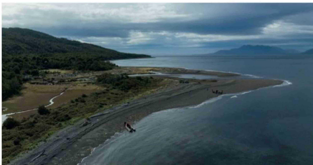
Vista del sector de Cabo Froward del estrecho de Magallanes.