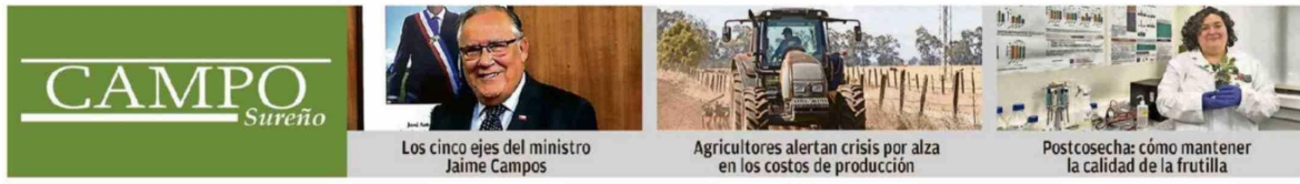
Los cinco ejes del ministro Jaime Campos