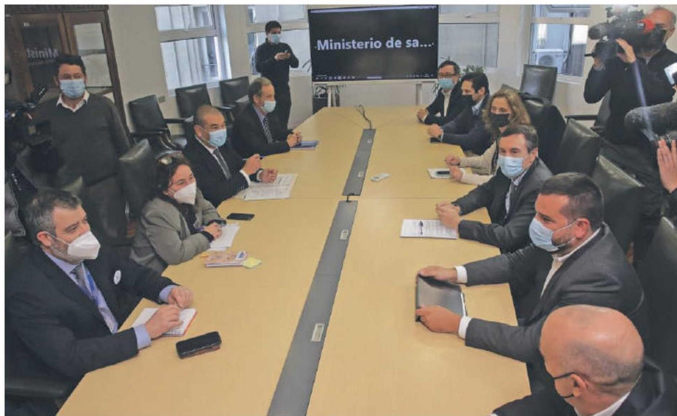
Nueva cita. Esta semana se vuelven a reunir las Isapres con las autoridades de Salud.

¿Quiebra? Aseguradoras suman pérdidas millonarias y por tercer año ven congelados el precio de sus planes.