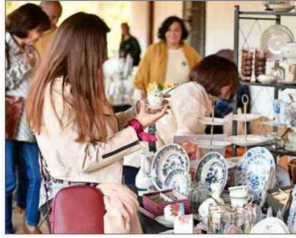
En Vitacura se realizará la actividad "¿Cuánto vale tu antigüedad?".