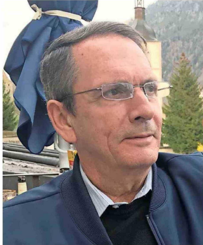
El agente de la inteligencia cubana, Enrique García, desertó en 1989 y huyó a Estados Unidos.