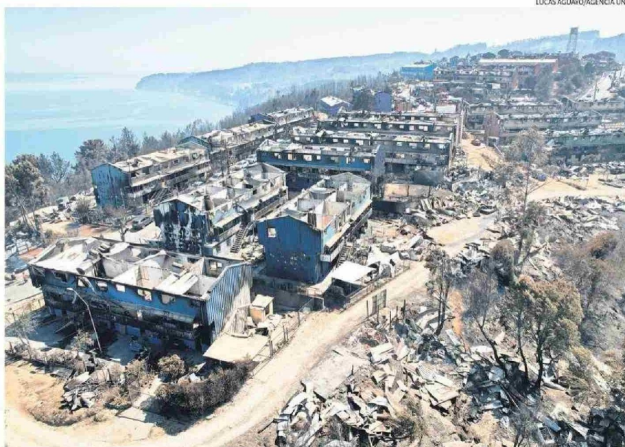
UNA IMAGEN DESOLADORA ES LA QUE QUEDA EN LA POBLACIÓN RÍOS DE CHILE, EMPLAZADA EN EL CERRO LA HUÁSCA EN LIRQUÉN.

ro igual comentaron que era difícil que volvieran a construir ahí, ya que la tierra está en mal estado”, complementó.